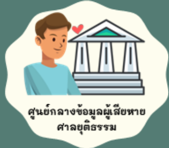
ศูนย์กลางข้อมูลผู้เสียหาย ศาลยุติธรรม